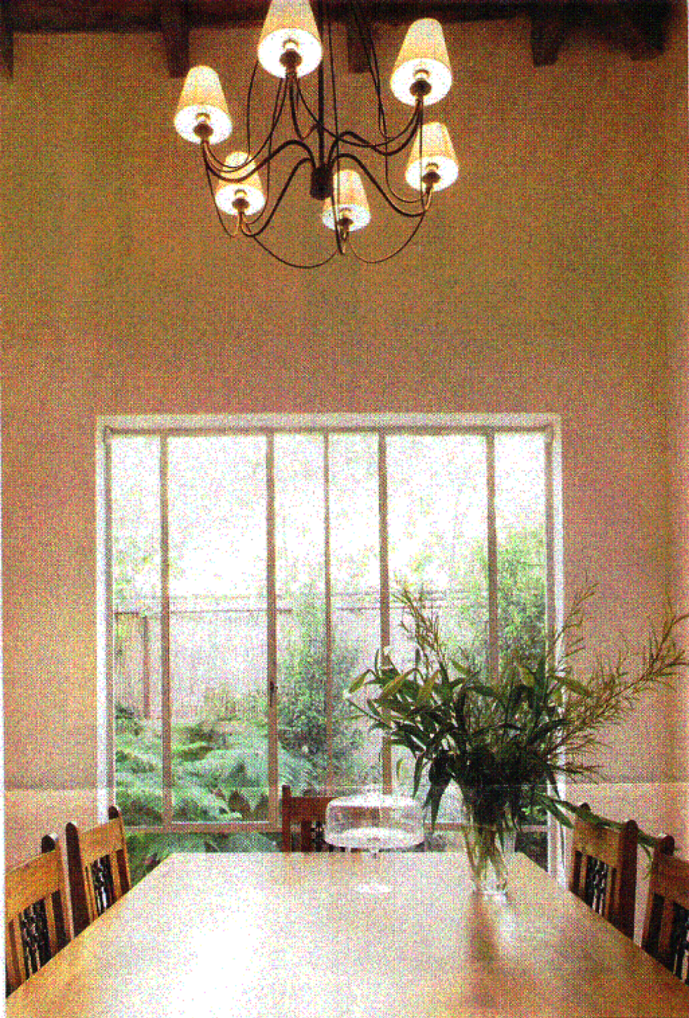
למעלה ובכיוון השעון: עוד מבט למטבח ולחלון הצרפתי מעל הכיור; הרבה מחשבה הושקעה בעיצוב המטבח, שכן בעלת הבית מאוד אוהבת לבשל ולהנות בו; מבט לפינת האוכל. התקרה הגבוהה והחלון הגדול נותנים תחושה של חלל גדול במיוחד