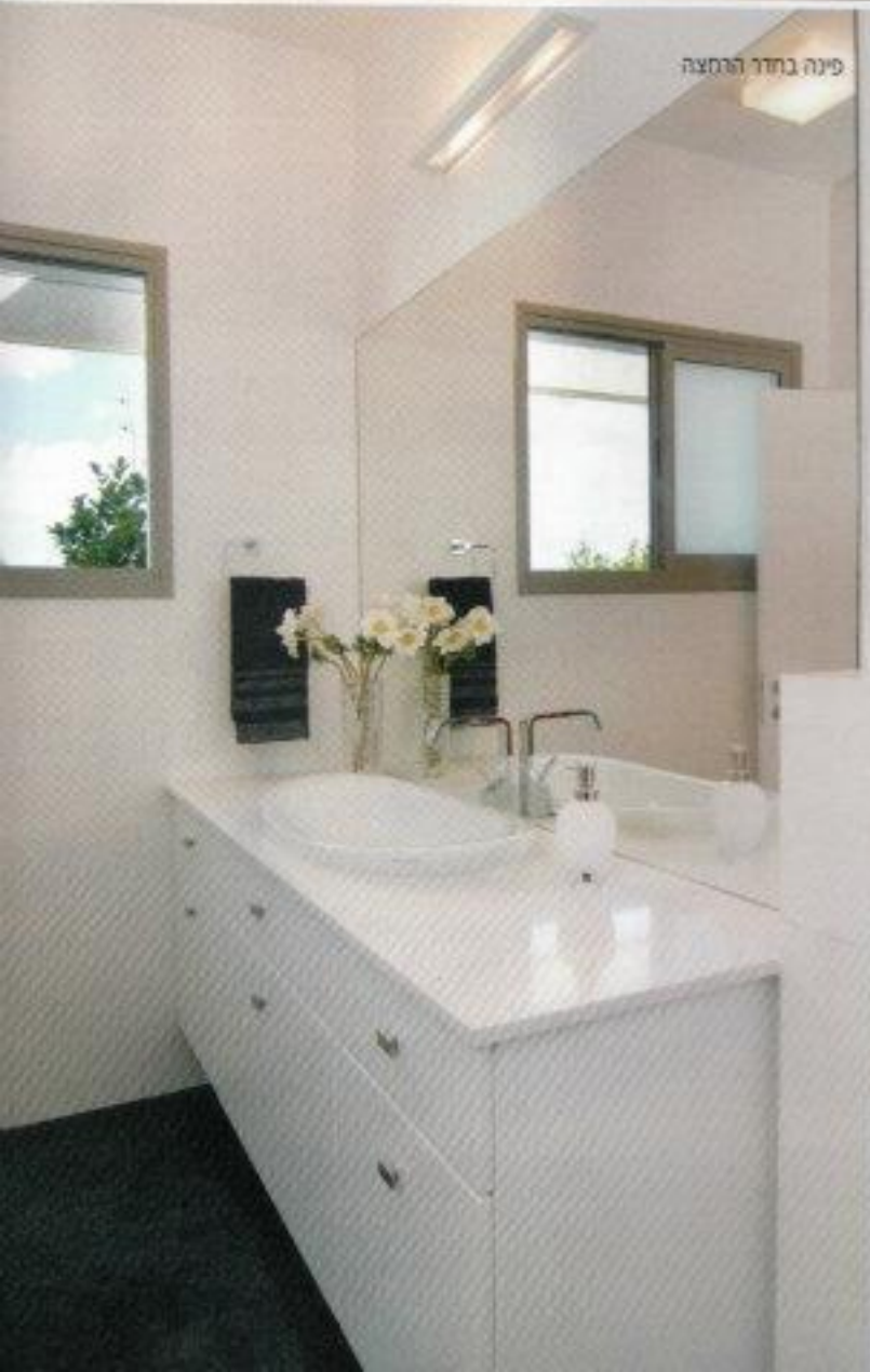
פינה בחדר הרמצה

פינת האוכל המצויה באותו חלל שילבה שולחן עשוי במבוק בגוון בדי בקווים נקיים, כאשר סביבו כיסאות בעיצוב רך. המטבח הצחור, המצוי אף הוא באותו החלל, הופרד באמצעות תקרה מוגמרת, ואי באורך 3.2 מטר. גוף תאורה באפור בטון ללא נורה נראית לעין משתלשל מעל אזור הישיבה באי (שעליו גם מצויות הכיריים המאורכות), וגוף נוסף, אפור כסוף, משתלשל מעל לפינת האוכל. כל יתר התאורה בחלל האירוח נטמעת בתקרה ובקירות.