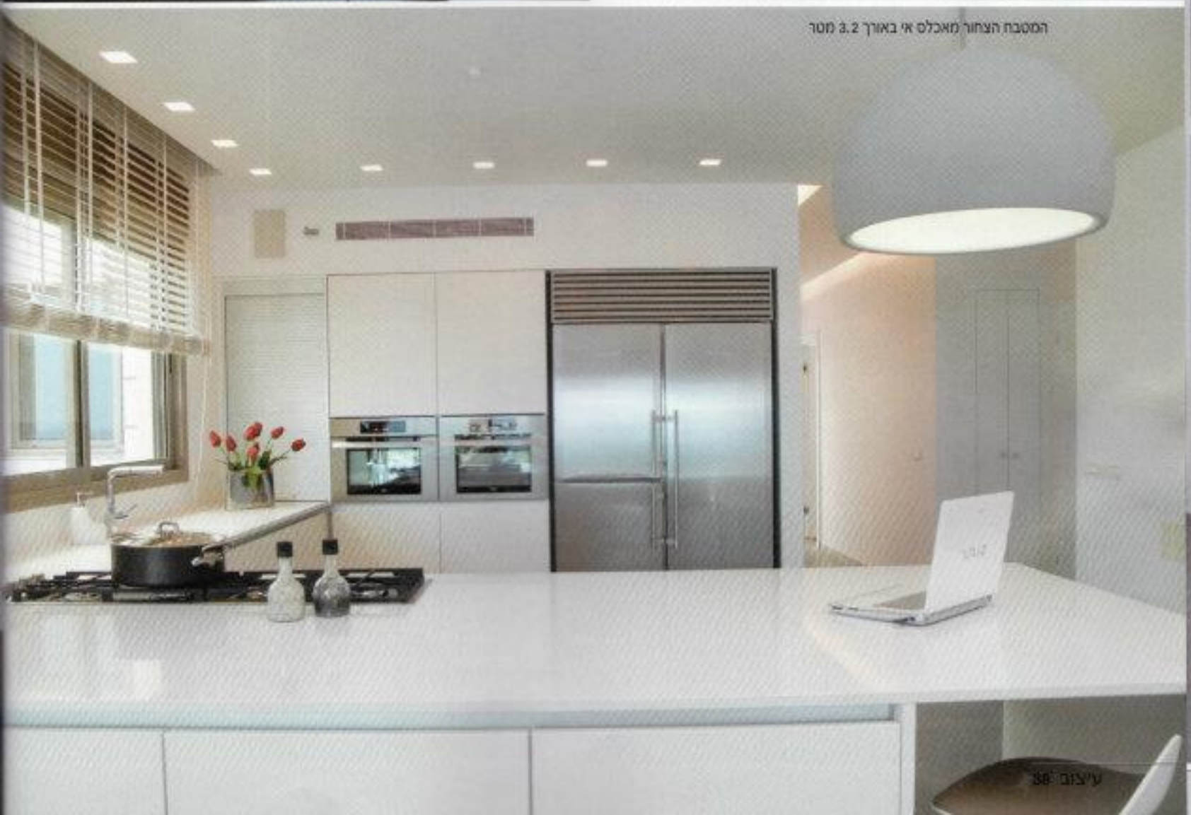
המטבח הצחור מאכלס אי באורך 3.2 מטר

הקו המודרני בבית שולב עם פריטים חמים, על מנת ליצור אווירה נעימה ועוטפת. הסלון - המצוי בחלל כפול בגובה 4.5 מטר - פתוח למרפסת והים הכחול ניבט מכל חזיתותיו. למרחב זה נבחר ריצוף אבן אפורה כהה לכל השטחים הציבוריים והמרפסת הפונה לים, ליצירת המשכיות. הספות הגדולות נבחרו בעור הפוך לבן, שתי כורסאות בוד בדיגום עשיר בגוני שחור אפור, ושולחן נמוך וגדול בגוון בדי השלימו מראה אלגנטי אבל לא מנוכר. ◀