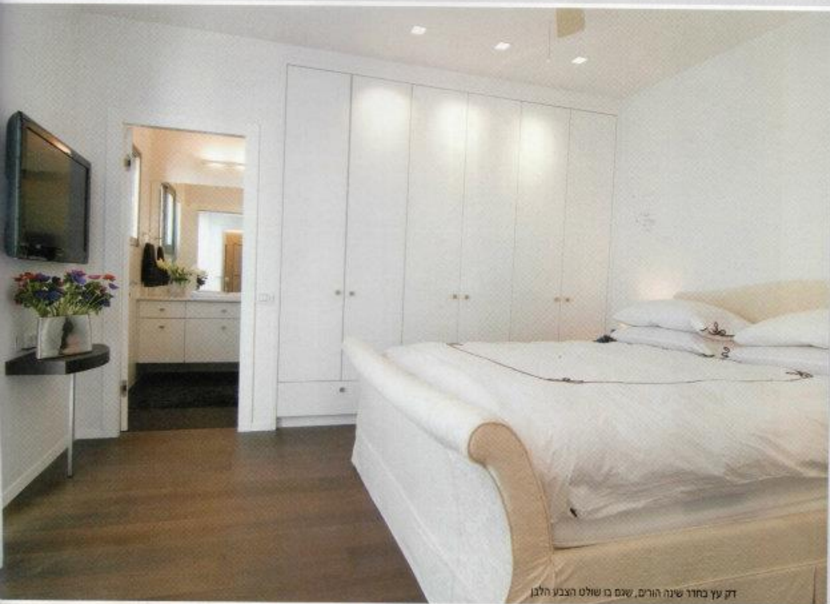
דק עץ בחדר שינה הורים, שאם בו שולט הצבע הלבן